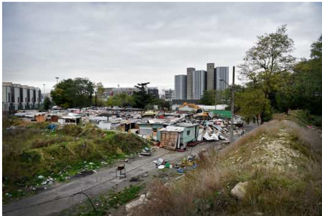
Le camp de Roms des Coquetiers à Bobigny, le lendemain de l'évacuation.

une mosquée en construction. Aujourd'hui encore, le chantier paraît en panne, faute d'argent, mais on a installé une grande tente blanche afin d'abriter les offices, et notamment la prière du vendredi. Les deux toilettes chimiques installées à l'entrée du camp des Roms n'ont jamais suffi pour ses centaines d'habitants et les habitués de la mosquée sont outrés de découvrir, chaque fois qu'ils se rendent à la prière, adultes et enfants faisant leurs besoins à deux pas.